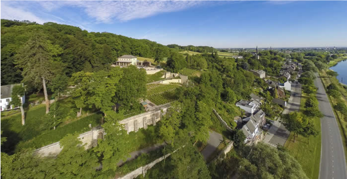
Geheimtip: 'casino' Slavante, 19 e eeuwse uitspanning met prachtig zicht over het Maasdal