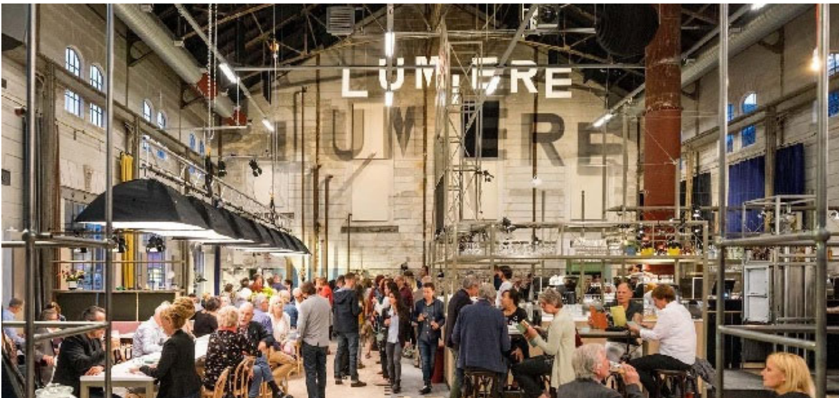
Restaurant Lumière is de jongste aanwinst van culinair Maastricht en na het eten meteen een filmpje pikken!

Ook VALKENBURG heeft het nodige te bieden, maar de keuze is een tandje minder dan in Maastricht.