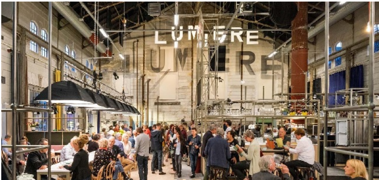
Restaurant Lumière is de jongste aanwinst van culinair Maastricht en na het eten meteen een filmpje pikken!

Ook VALKENBURG heeft het nodige te bieden, maar de keuze is een tandje minder dan in Maastricht.